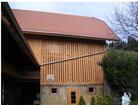
Verbretterung Wand bei Hocheinfahrt

Art. 24 Raumplanungsgesetz (RPG), Art. 39 Abs. 1 Bst. a, b und Abs. 3 sowie Art. 43a Raumplanungsverordnung (RPV) und Art. 84 Abs. 1 Baugesetz des Kantons Bern (BauG)