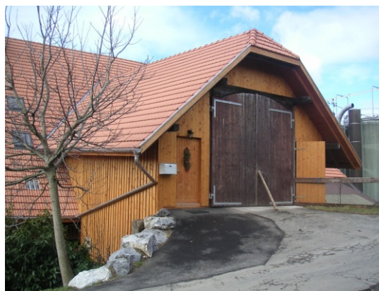
Wohnungszugang über Hocheinfahrt

Es ist abzuwägen, ob vom Bauwerk und seinem Betrieb Störungen wie Lärm oder Geruch ausgehen, die nicht zumutbar sind. Dieses Kriterium dürfte bei Wohnbauten von untergeordneter Bedeutung sein.