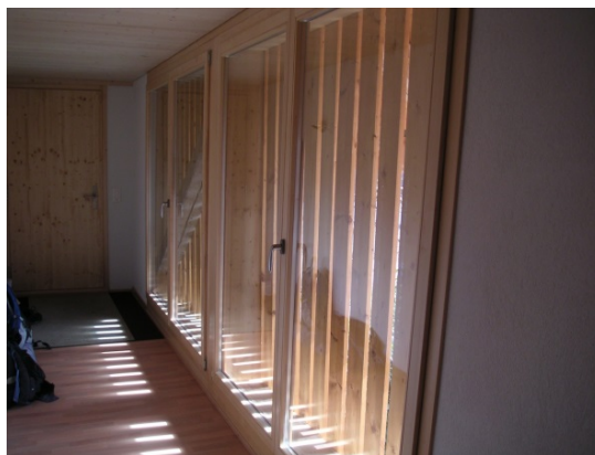
Zugang innerhalb Hocheinfahrt